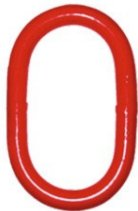
Anneau de tête